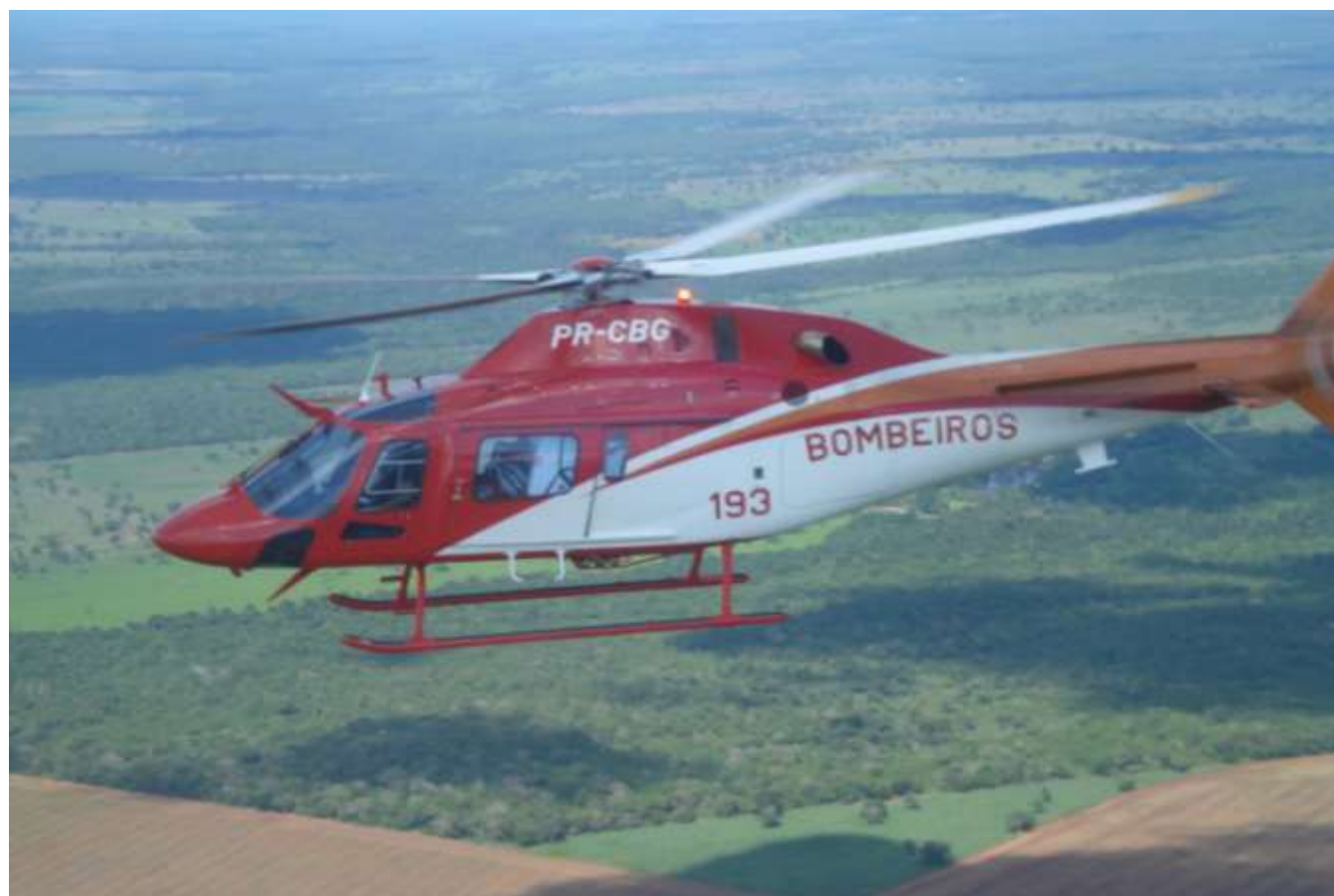
AW119 Ke - koala

Efetivo de 07 PCH, 03 Tripulante e 03 mecânicos