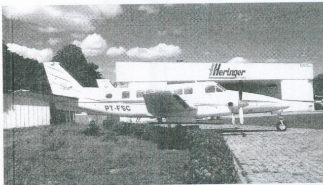
AERONAVE BIMOTO KINGAIR BE99 PREFIXO PT-FSC (ITEM 3)

Declaramos total conhecimento e concordância com os termos deste Edital;