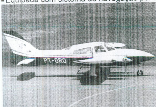
AERONAVE BIMOTOR CESSNA 310 R PREFIXO PT-ORQ (ITEM2)