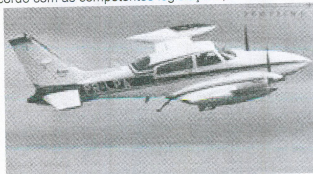
AERONAVE BIMOTOR CESSNA 310 R PREFIXO PR-LPA (ITEM2)