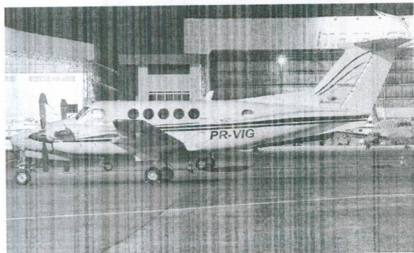
AERONAVE BIMOTOR KINGAIR BE20 PREFIXO PR-VIG (ITEM 3)